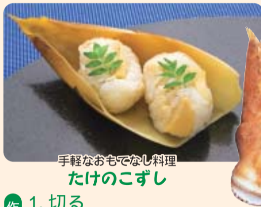
手軽なおもてなし料理 たけのこずし

父の仕事を継ぐ気はなかつたが、学生時代に二条城模写室に入り、静かで真刻な空間に惹かれた。女性スタッフも多い。現在所内の男女比はほぼ半々。日本画の古典技法を学んだ学生が多い。志す人にひと言、「この仕事をやる以上、自分の絵を描き続けなさいが亡父の方針でした。」